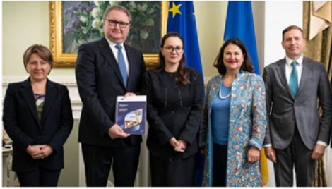
Фото: Інформаційний центр Українського уряду отримав від посла ЄС в Україні Катерини Матерної Звіт про розширення 2025. Київ, 6 листопада 2025 року